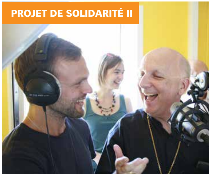
Dans les studios de Radio Fisherman.