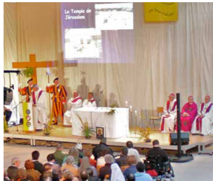
Après la messe familiale (g.), la communauté et les moments de jeu ne sont pas négligés lors du «festival des familles» (dr.).