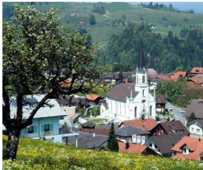
L'église paroissiale St-Nicolas, centre géographique et religieux de Doppleschwand.