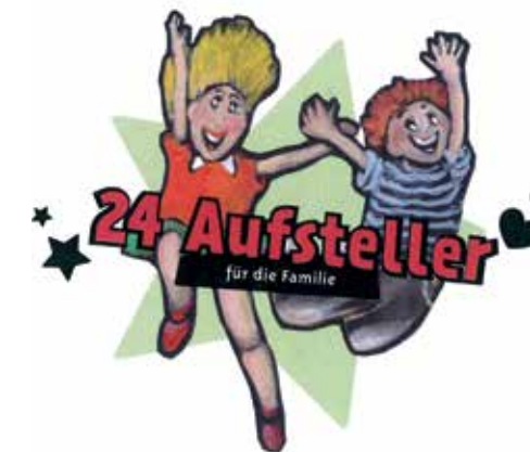
«24 encouragements» pour toute la famille: un des trois projets du Jeûne fédéral en 2013.

Les adultes reçoivent une petite information sur le sujet et une impulsion spirituelle. Comme évoqué dans l'Info MI du Jeûne fédéral l'an passé, la Mission Intérieure a soutenu le lancement du projet par un prêtre. Bilan après un an: son succès est encourageant – plus de 3000 exemplaires du jeu de cartes ont pu être vendus. Un grand merci cordial à toutes les donatrices et tous les donateurs qui ont permis le lancement du projet.