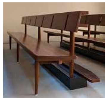
A donner: 16 bancs d'église.

d'entre eux ont une surface d'assise de 338 x 38 cm, et dix ont une surface de 238 x 38 cm. Les bancs peuvent être récupérés gratuitement. Prenez donc contact avec nous. Par exemple par téléphone (041 710 15 01) ou par e-mail (info@solidarite-mi.ch). Vous trouverez de plus amples informations sous: www.solidarite-mi.ch/marktplatz