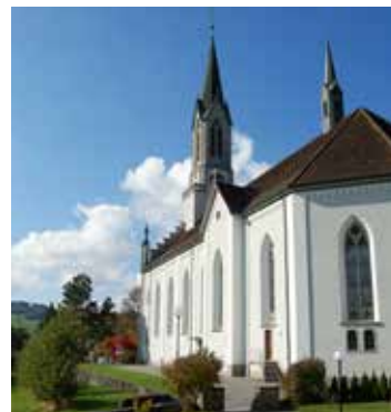
L'église paroissiale de Bünzen (AG).

cord avec l'évêché, Bünzen avait été désigné comme bénéficiaire de la quête de l'Épiphanie 2014 (cf. Info MI 1/14). Cette inauguration signifiait la fin des travaux d'une restauration réussie. A l'occasion, venez visiter ce splendide bijou néogothique de 150 ans avec son histoire mouvementée, cela en vaut la peine.