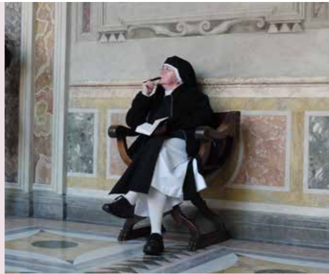
Sœur Ruth a conçu le «compagnon de chemin» pour la MI.

Sœur Ruth: Le compagnon de chemin est comme un «pacemaker» dans le quotidien, à nos côtés sur le chemin de vie. La répétition de la prière fonctionne comme un pacemaker. Le compagnon de chemin devrait nous donner de la confiance dans la vie. Car, que peut-il nous arriver si Dieu nous accompagne sur notre chemin de vie? L'aide de Dieu est soi-disant une «aide gratuite» en face