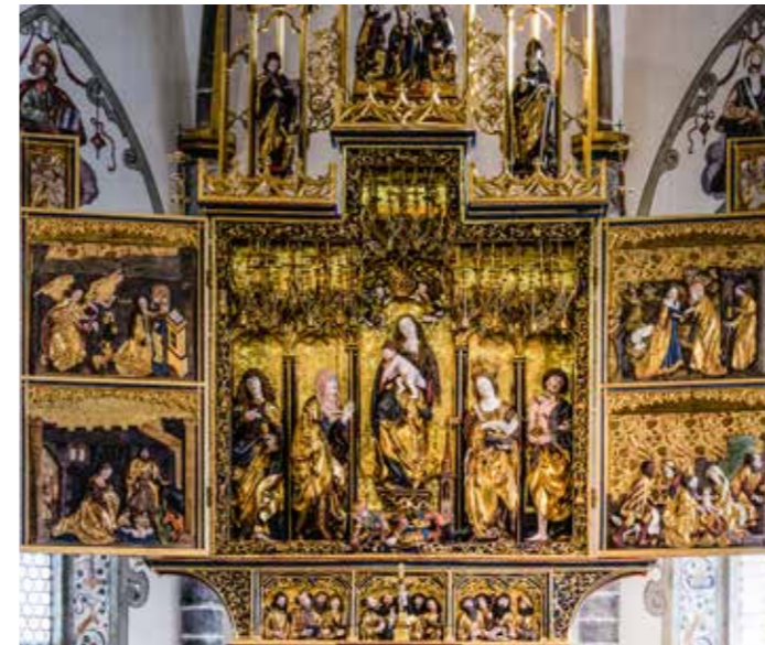
Les richesses historiques et la communauté sont au centre de l'excursion culturelle annuelle de la MI – comme en 2013 à Münster-Reckingen (VS).