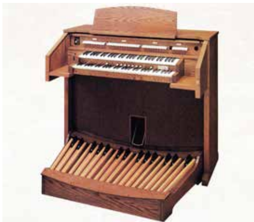
A donner: un orgue digital de la marque «Allen».

mi. La solidarité renforce! Les trouvailles de la Mission Intérieure sont alignées à ce principe. Elles offrent la possibilité de faire cadeaux d'objets ecclésiaux et liturgiques. Actuellement un orgue digital (image) cherche un nouveau propriétaire. L'instrument provient d'une personne privée et fonctionne parfaitement. Après qu'un premier orgue a pu être commuté en janvier, la Mission Intérieure se réjouirait si cet instrument trouvait également un nouvel emplacement dans un environnement ecclésial. Si votre paroisse est intéressée, contactez-nous donc. Appelez-nous au numéro 041 710 15 01 ou écrivez-nous un mail à l'adresse: info@solidarite-mi.ch . Vous trouverez des informations techniques plus détaillées sous: www.solidarite-mi.ch/marktplatz