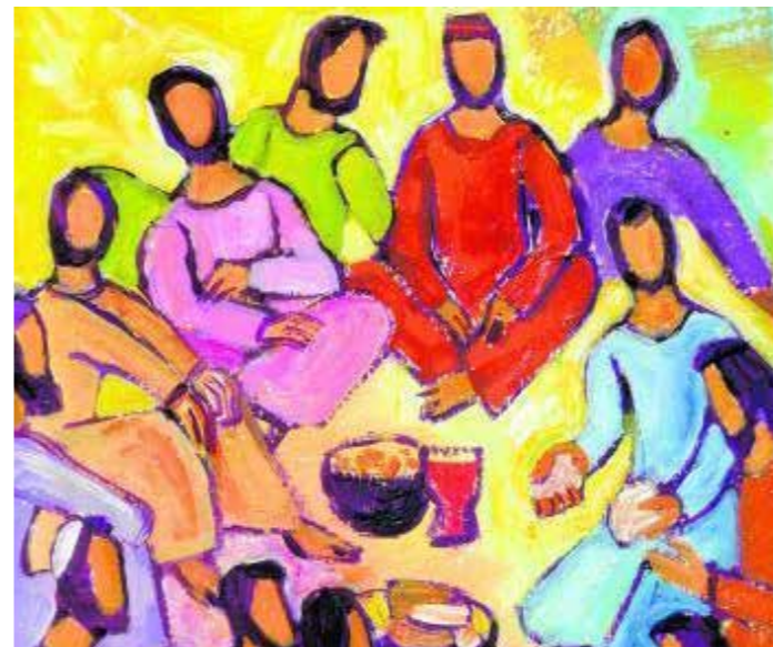
Lors du projet «l'Evangile à la maison», des fidèles se retrouvent régulièrement en groupe au milieu de leur salon pour la lecture de la Bonne Parole (g.). L'artiste-peintre «Berna» a peint une série de tableaux (g.). L'année Luc (Canton Vaud) a été lancée en novembre 2012 par une célébration œcuménique (dr.).

La radio «Fisherman.FM» est une radio en ligne, qui peut être captée en ligne moyennant un ordinateur ou un téléphone portable. Cette radio ne peut pas être reçue par l'antenne d'un appareil radio classique. Pour la réception sur le téléphone portable, il faut un programme spécial, une application iPhone. Avec ce concept de diffusion, la radio Fisherman s'adresse surtout à des jeunes gens. La radio en ligne et toutes les informations au sujet du projet sont accessibles sous: www.fisherman.fm