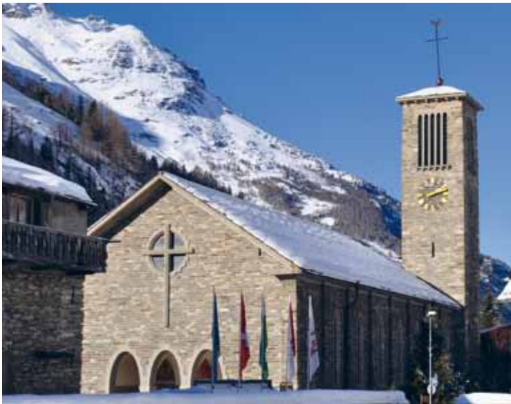
Depuis des décennies, seuls les travaux d'entretien urgents ont été entrepris: église St-Barthélémy à Saas-Grund.