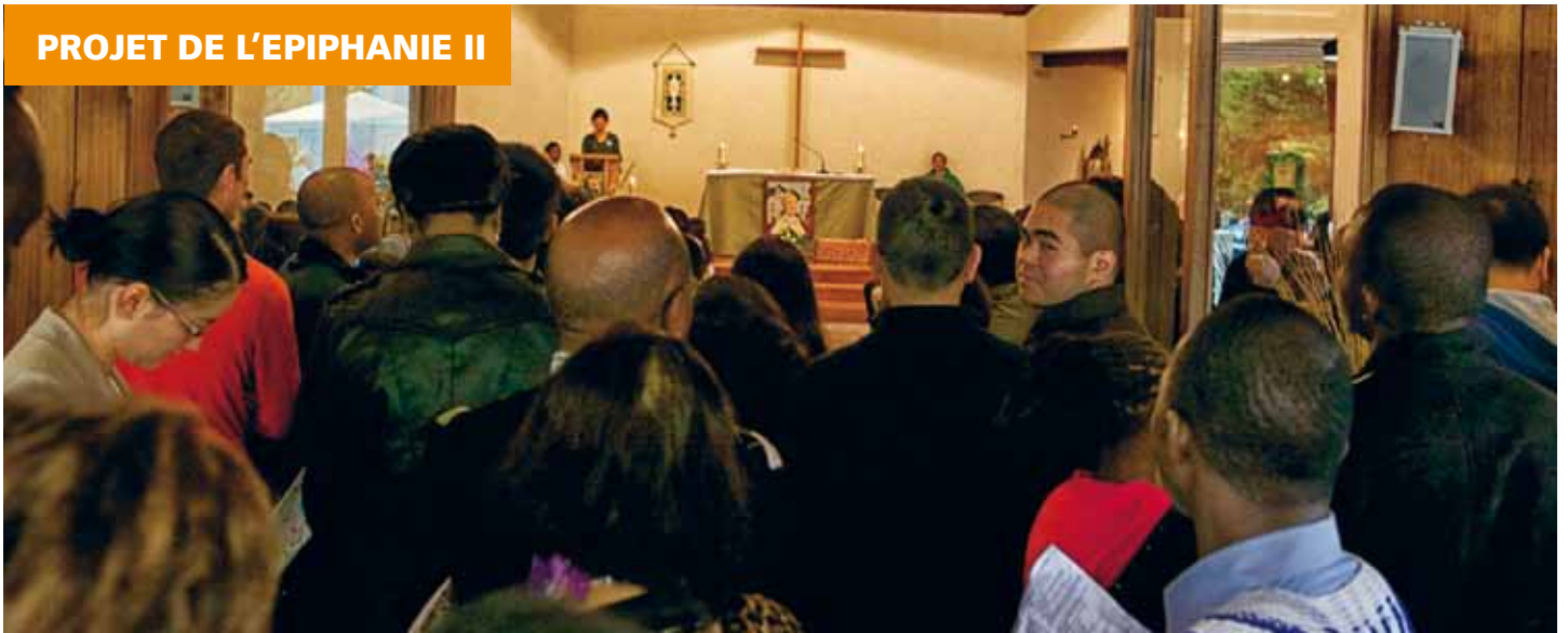
Manque de places: la paroisse anglophone Jean XXIII déménage bientôt.