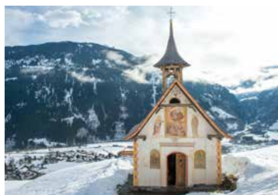
6. 1. 2013: Les cloches de solidarité retentissent également à Rabus (GR), où la MI avait soutenu la rénovation des cloches.