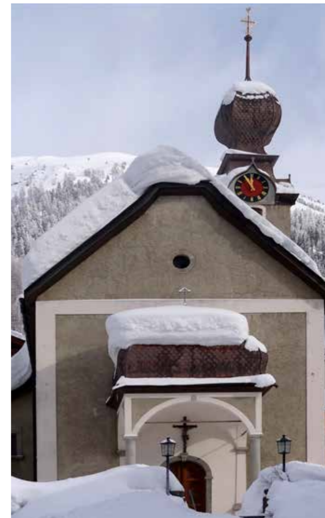
Il est moins une: la restauration de l'intérieur de l'église paroissiale de Blitzingen est urgente.

Chaque année lors de la fête des Rois (Épiphanie), les paroisses suisses appellent à la collecte en faveur de la Mission Intérieure. Cette collecte de l'Épiphanie profite aux paroisses de toute la Suisse dans le besoin. Chaque année, la Conférence des Evêques Suisses (CES) désigne trois paroisses qui recevront une partie de ces dons. Les autres dons sont versés au fonds de l'Épiphanie, qui viendra en aide à d'autres paroisses. Selon les possibilités, toutes les parties du pays sont prises en compte lors de la distribution de l'argent.