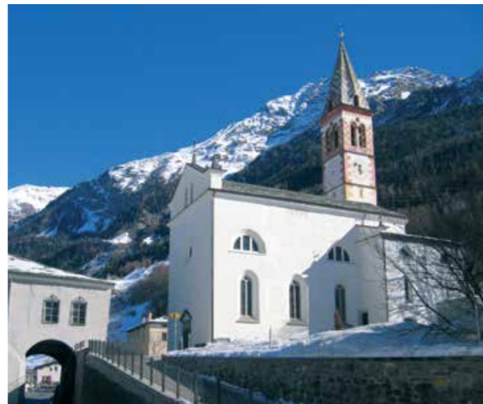
Les églises d'Augio (g.) et de San Carlo (dr.), conjointement avec 57 autres paroisses, se voient exonérées d'une partie de leur emprunt.