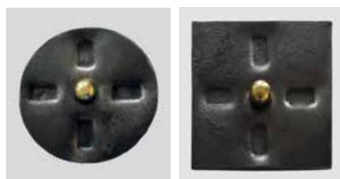
La croix arrondie et la croix carrée «juste milieu» de la collection MI.

Commande par téléphone au 041 710 15 01 ou par e-mail: info@solidarite-mi.ch