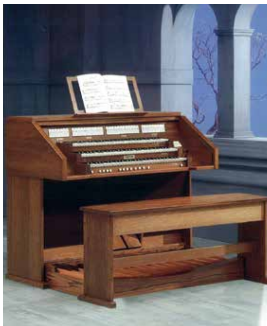
A donner: une orgue du modèle «Cantor».