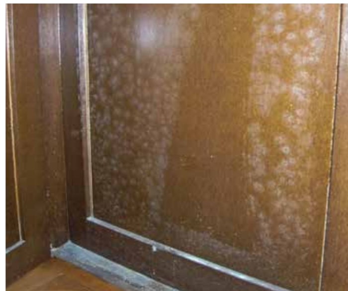
L'apparence extérieure est trompeuse: à l'intérieur de l'église paroissiale de Bünzen, la moisissure se propage.