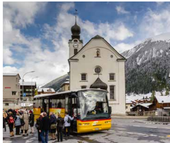
Direction l'église de Reckingen en car postal, où Urs Staub (sur l'ambon) mena la visite guidée de l'église de grande valeur culturelle.