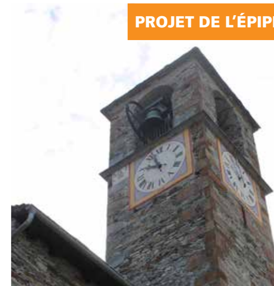
Si on n'intervient pas rapidement, les œuvres d'art de Gordevio disparaîtront à tout jamais.