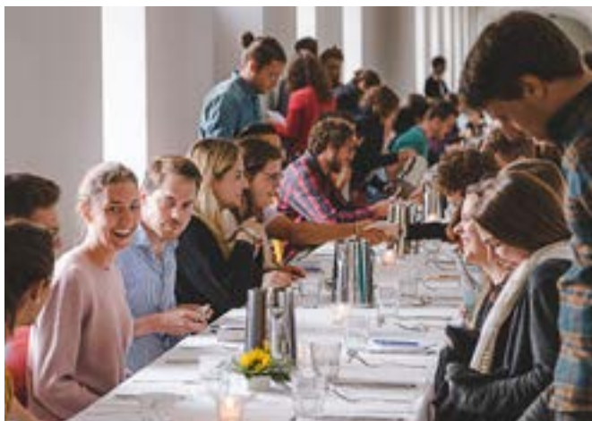
«Vers Dieu»: repas commun au monastère d'Einsiedeln.

Grâce à la collecte du Jeûne fédéral 2020 et aux contributions de communes ecclésiastiques et de paroisses et de particuliers, la Mission Intérieure, en 2020, a soutenu 69 projets pastoraux et dix prêtres qui avaient besoin d'aide pour des raisons de santé. Du fait de la pandémie de coronavirus, 2020 a été une année hors du commun. Certains événements majeurs habituellement soutenus par la Mission Intérieure n'ont pas pu être organisés. En raison de la restriction du nombre de fidèles, la collecte du Jeûne fédéral 2020 a été nettement inférieure à celle des années précédentes. Les dons privés, heureusement plus abondants, n'ont cependant pas pu compenser le déficit de collecte. La Mission Intérieure a alloué 743 000 francs en 2020 pour des projets pastoraux et des subventions aux paroisses de montagne. Elle a en outre dépensé 65 000 francs pour l'aide aux prêtres en besoin.