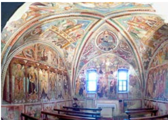
L'ancien chœur de l'église paroissiale San Michele à Palagnedra (TI).

Avec le produit de la collecte de l'Épiphanie effectuée les 5 et 6 janvier 2020 dans toutes les paroisses de Suisse, la Mission Intérieure a soutenu trois paroisses pour la rénovation de leur église: l'église Saint François-Xavier à Münchenstein (BL), l'église de la Nativité de la Vierge Marie à Reckingen (VS) et l'église San Michele à Palagnedra (TI). En plus, les dons privés reçus lors des collectes de printemps et d'été ont permis de soutenir le réaménagement liturgique de l'église paroissiale de Bex (VD) et du monastère Maria Opferung à Zoug. En outre, quatre prêts ont été accordés et des contributions sans obligation de remboursement ont été versées pour onze projets de rénovation de moindre envergure. La Mission Intérieure a fourni un total de 1,084 million de francs en contributions directes pour le financement de rénovations et a déboursé 756 000 francs suisses en prêts.